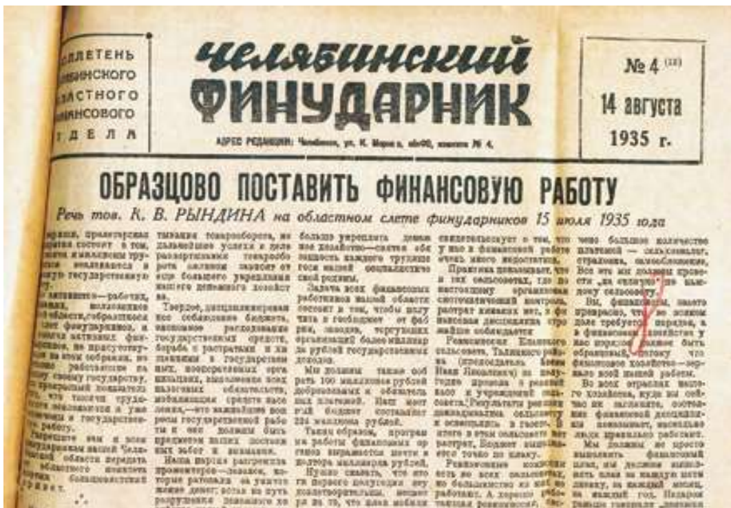
Финансовая газета, выпуск №4, 1935 год

В октябре 1937 года в структуре финансового органа области было создано контрольно-ревизионное управление (КРУ), на которое возлагалась проверка соблюдения законов о бюджетных правах, контроль за исполнением бюджетов, за правильным и экономичным использованием бюджетных средств, за соблюдением штатного расписания. Финансовый контроль обеспечивали контролеры-ревизоры.