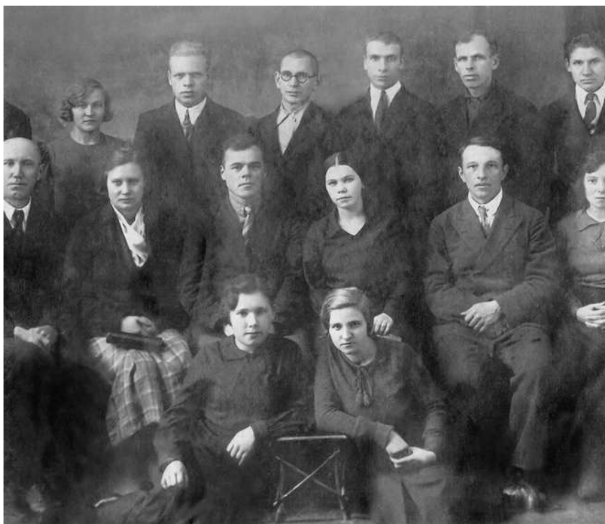
Сотрудники бюджетного отдела ОблФО, 1937 год

В октябре 1937 года в структуре финансового органа области было создано контрольно-ревизионное управление (КРУ), на которое возлагалась проверка соблюдения законов о бюджетных правах, контроль за исполнением бюджетов, за правильным и экономичным использованием бюджетных средств, за соблюдением штатного расписания. Финансовый контроль обеспечивали контролеры-ревизоры.