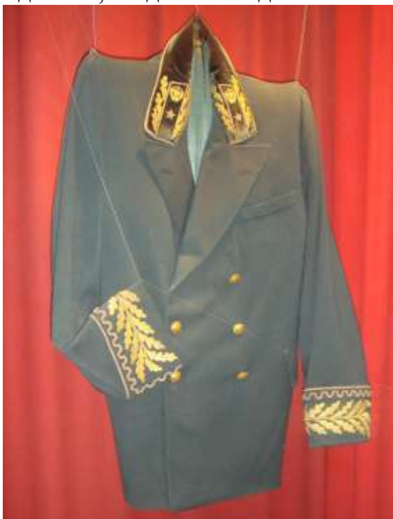
Форма финансового работника

Укрепление финансовой системы СССР в 1950-е годы сопровождалось введением форменной одежды, званий, требований к образовательному уровню специалистов финансовых органов, утверждением порядка награждения орденами и медалями, введением надбавок за выслугу лет.