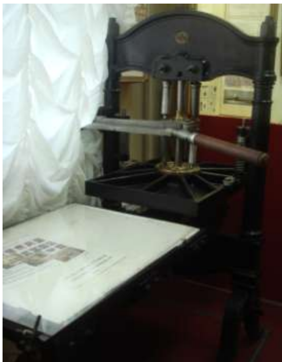
Печатный станок Министерства финансов России, 1893 год

Учитывая недостаток кадров, первоочередной задачей Губфинотдела стало распределение авансов на расходы отделам Губревкома и подготовка смет на октябрь – ноябрь 1919 года. Только с появлением в январе – марте 1920 года в Челябинске реэвакуированных специалистов из Сибири началась активная организационная работа по формированию финансового аппарата Губернии.